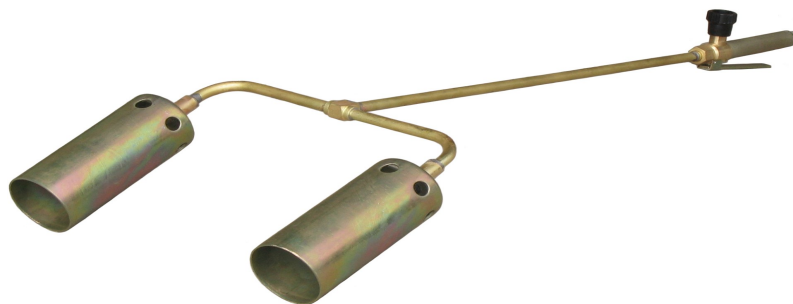
Рис.3 Горелка модели ГВ ДЖЕТ 119-20

5.12 При работе с горелкой модели ГВ ДЖЕТ 119-21 следует применять средства защиты рабочего от высокой температуры.